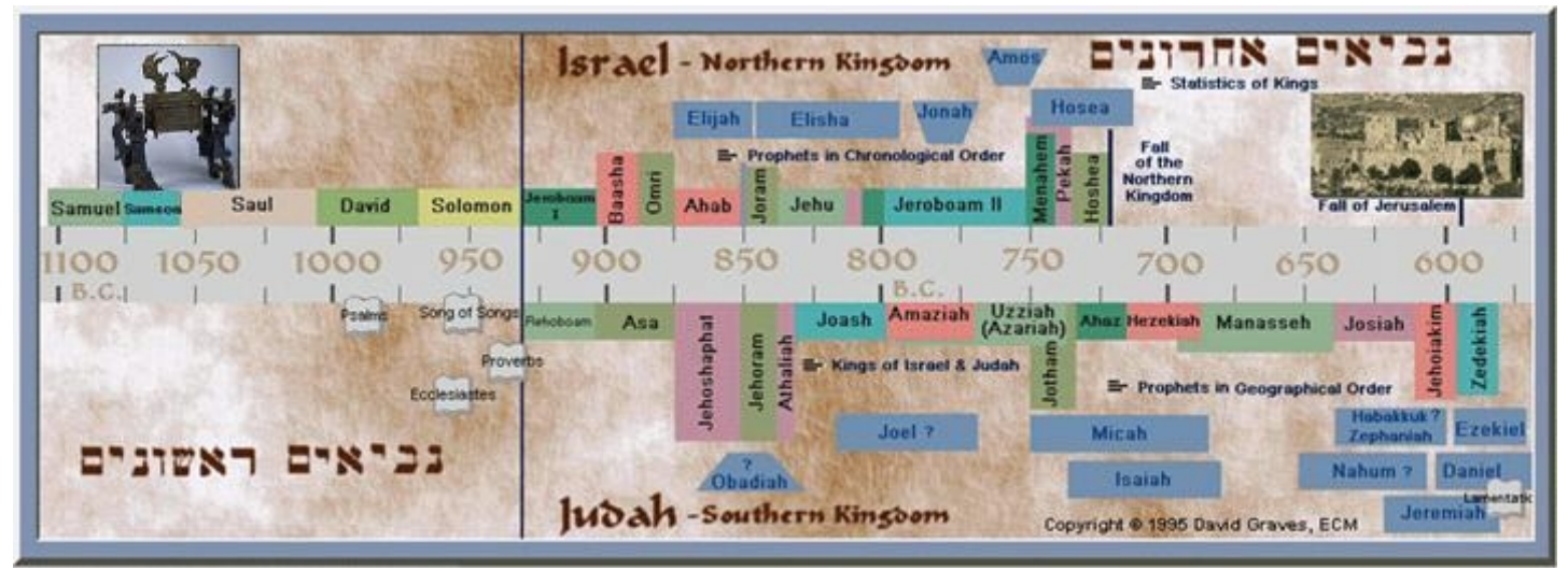
↑ This is when the Haftorah happened.